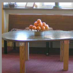
BORD HOTELL KRISTINA I SIGTUNA