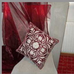
FOTÖLJ HOTELL KRISTINA I SIGTUNA